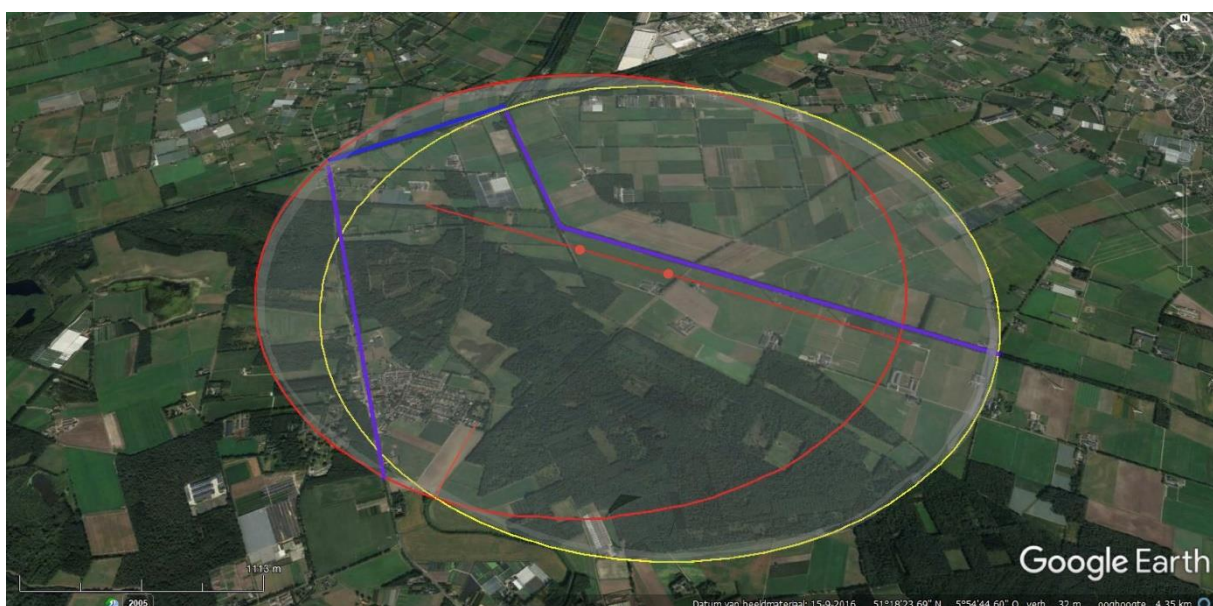
Fig.3 De invloedssfeer van Windpark Heibloem.